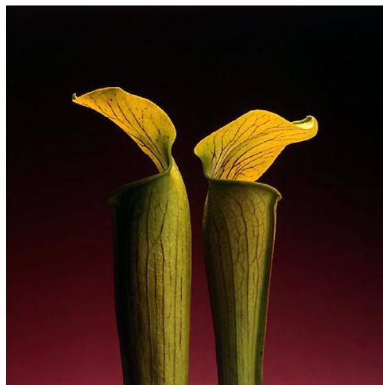
Double Jack in the Pulpit, 1988